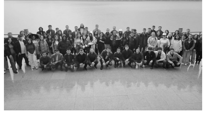
əldə ediblər. Ekskursiya zamanı ətraf mühitin qorunmasının əhəmiyyəti barədə maarifləndirici söhbətlər aparılıb. Həmin gün layihə işti-