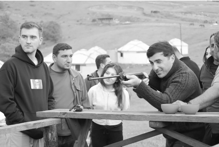
Yeni Azərbaycan Partiyasının (YAP) Mərkəzi Aparatı və partiyanın Gən-